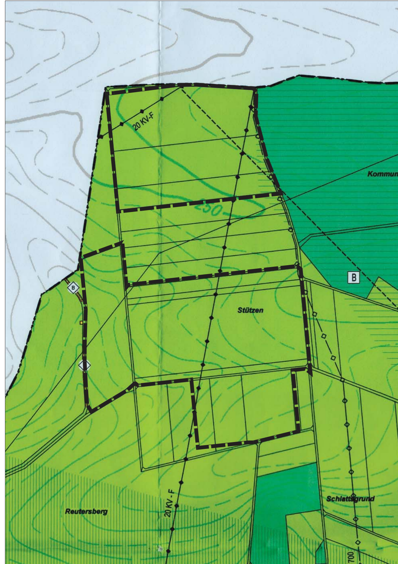
Kartengrundlage: Flächennutzungsplan, digitalisierte Fassung