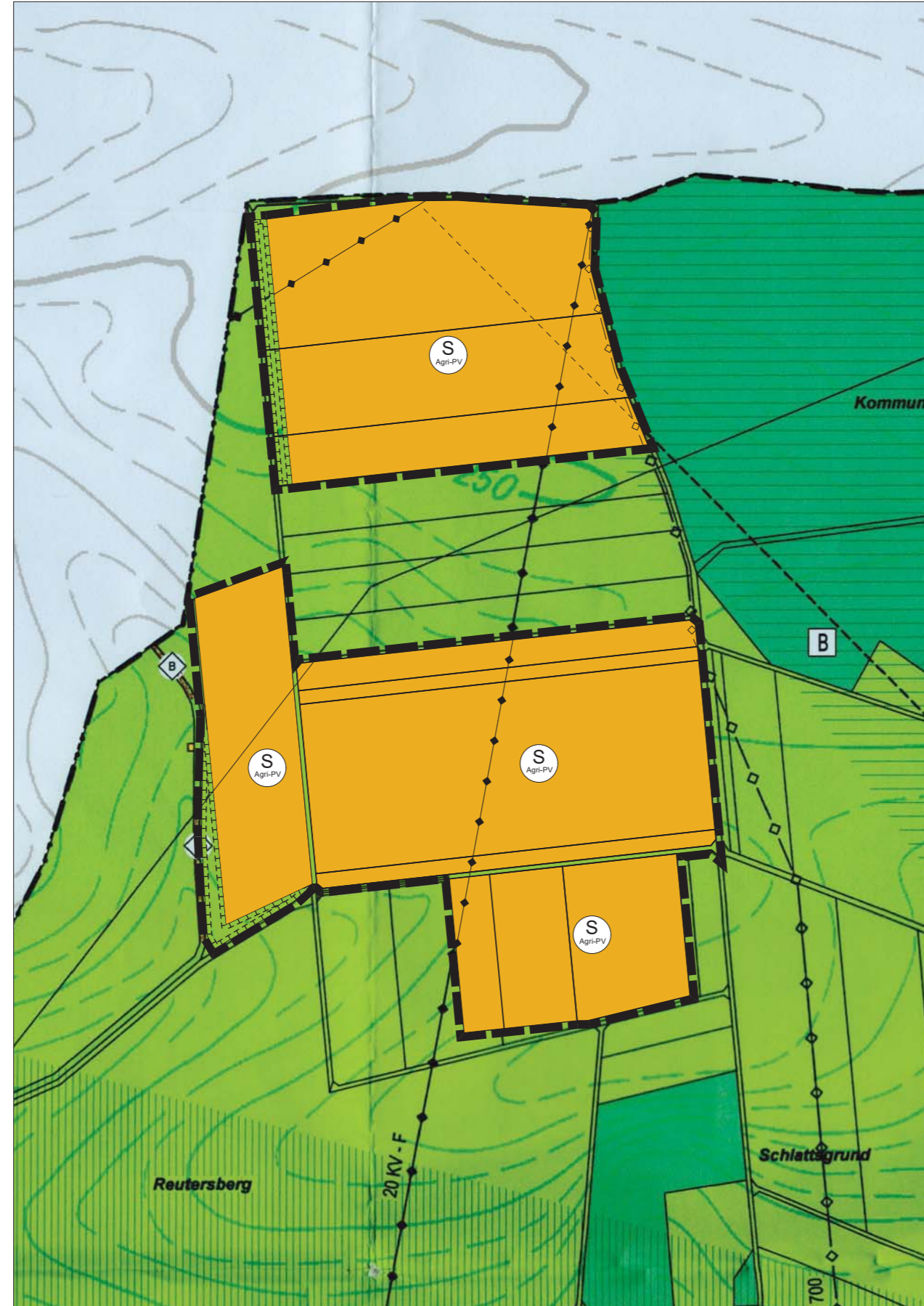
Kartengrundlage: Flächennutzungsplan, digitalisierte Fassung