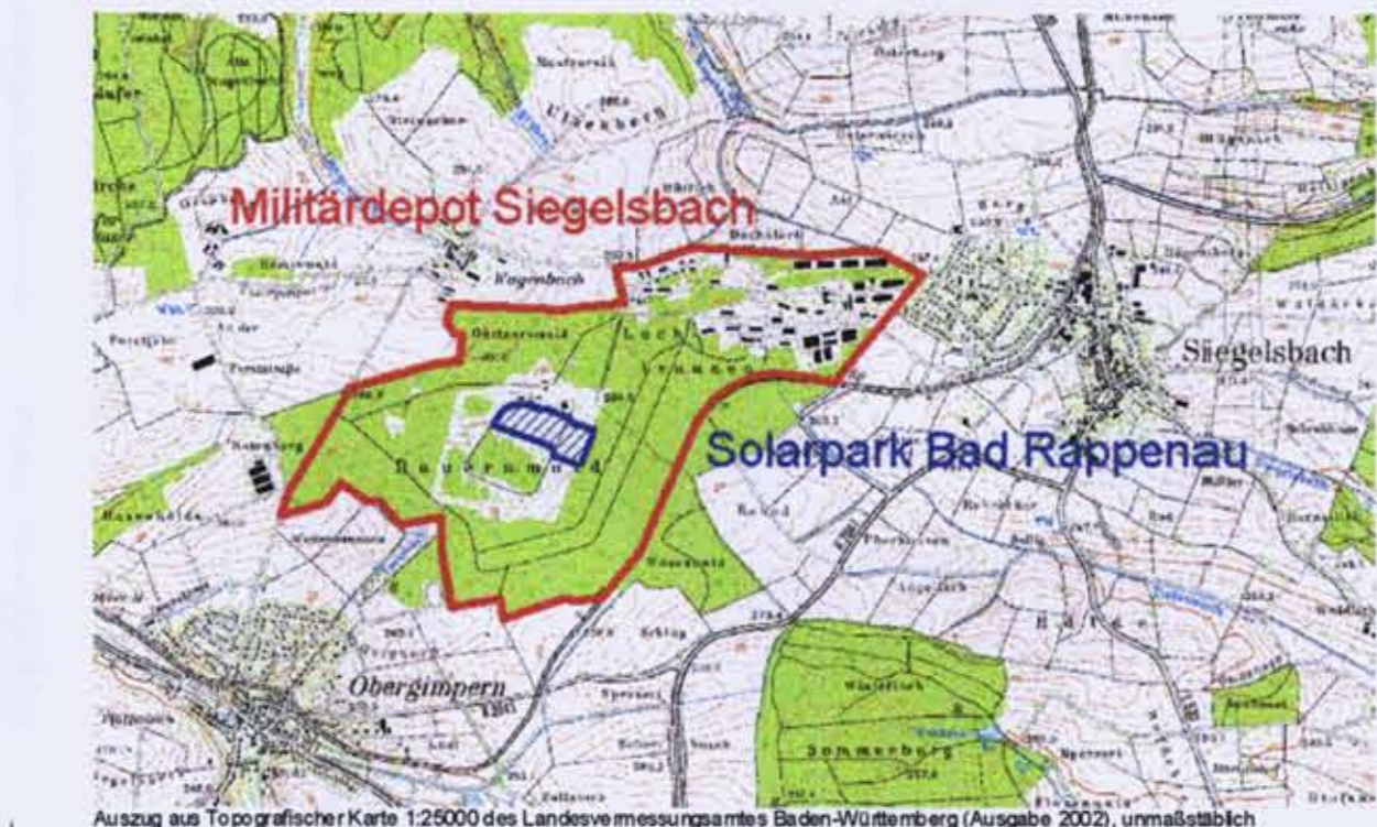
Auszug aus Topographischer Karte 1:25000 des Landesvermessungsamtes Baden-Württemberg (Ausgabe 2002), unmaßstäblich